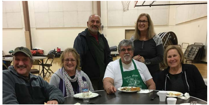
Los voluntarios de REST brindaron ayuda antes de la pandemia.