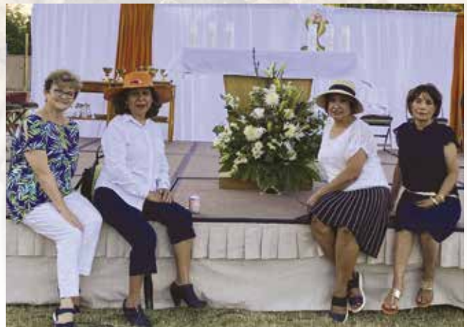
The Guadalupanas enjoy decorating the church with flowers each week.